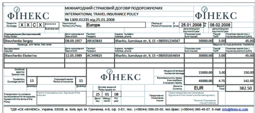
Рис. 3 Распечатка полиса